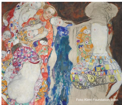
Gustav Klimt: Die Braut, 1917/18 (unvollendet), derzeit im Oberen Belvedere, Wien ausgestellt, ist das Herzstück der Sammlung.