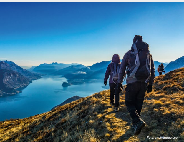
Die „Climate + Philanthropy: A Compact Learning Journey“ weist Stiftungen und ihrem Umfeld den Weg Richtung Klimaschutz.

@ActPhilanthropy ; #ClimatePhilanthropyCourse