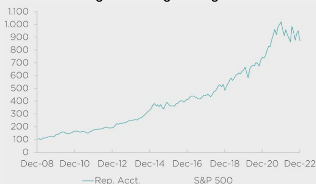
Wertentwicklung US-Strategie Comgest 2009–2022

comgest.com/de – thecomgestfoundation.com